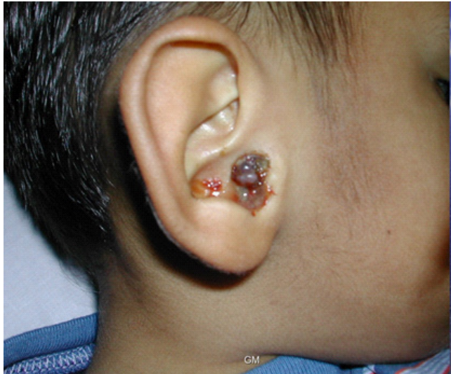
Figura 2: Paciente de 3 años con cuadro de parálisis facial inicialmente manejada como idiopática con aparición de masa en CAE 20 días después. Diagnóstico de Rabdomiosarcoma embrionario de oído estado IV. Fallece dos meses después del egreso.

Se toman exámenes de extensión los cuales son negativos. Por tamaño de la masa y extenso compromiso de estructuras circundantes sin evidencia de metástasis ni compromiso intracraneano se inicia tratamiento adyuvante con quimioterapia VAC 3 ciclos, hospitalización y radioterapia. La paciente es dada de alta y no regresa a la institución para continuar el tratamiento. Se desconoce estado actual.