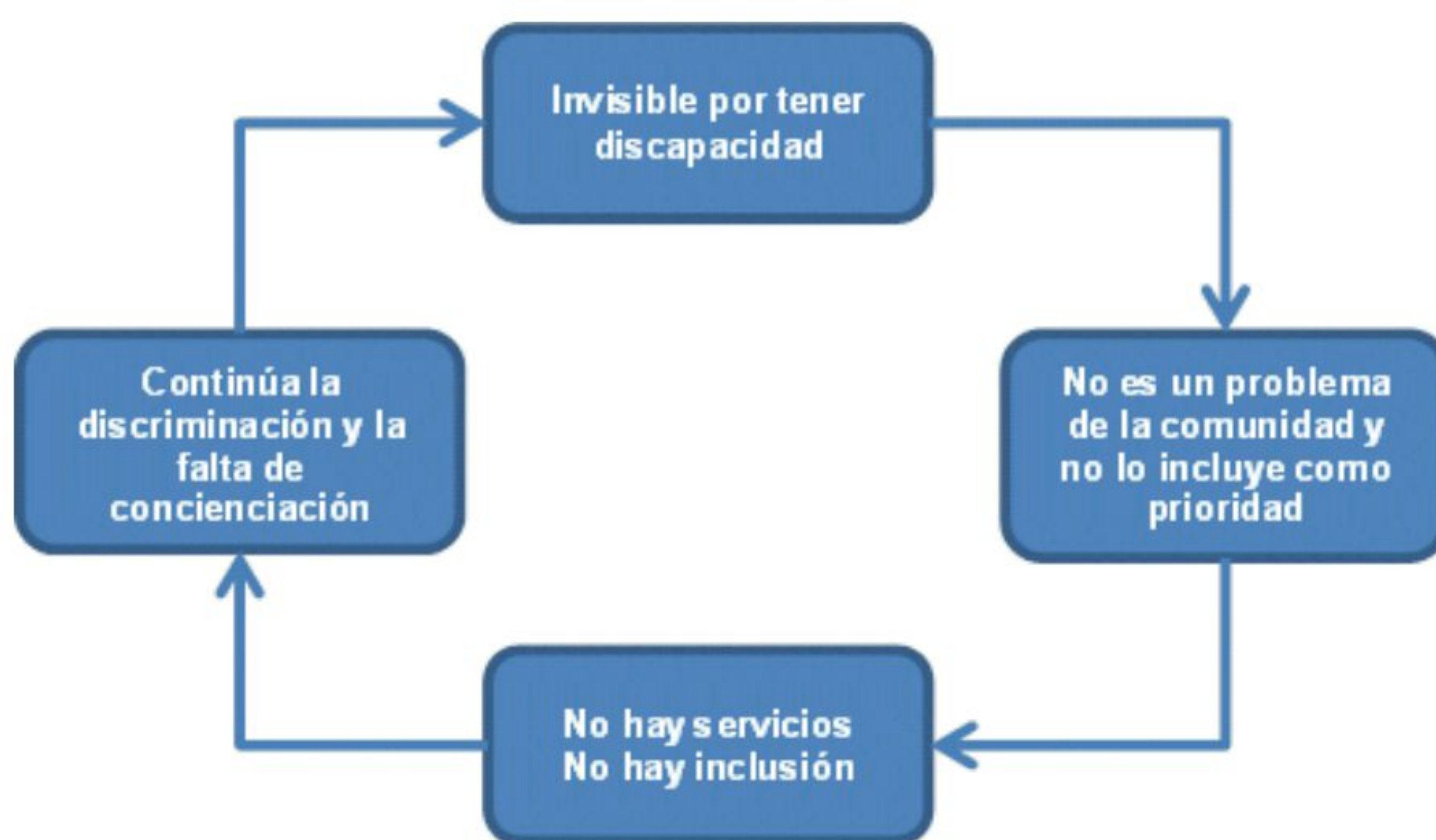
Figura 1: Ciclo de invisibilidad de la discapacidad.

Para describir el problema de acceso a las TIC de las personas con discapacidad, Sánchez (6) retoma del Banco Mundial llamado “el ciclo de la invisibilidad” (Figura 1), a través del cual se pone de manifiesto que las personas con discapacidad son excluidas muchas veces de las políticas de cooperación al desarrollo, como si fueran invisibles.