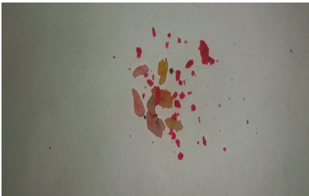
Figura 3. Restos de rodenticida en forma de pellets y alimentos de un niño que presentó emesis.

También denominados superwarfarinas; su presentación es en forma de pellets (Figura 3) y bloques parafinados para arrojar en zonas húmedas. Su mecanismo de acción es la inhibición de la síntesis hepática de los factores de coagulación II, VII, IX y X, dependientes de vitamina K. Los síntomas, derivados de una excesiva anticoagulación son: equimosis, epistaxis, hemorragia subconjuntival, gingivorragia, hematemesis, melena o hematuria con dolor en flanco. Las complicaciones inmediatas y severas son anemia, hemorragia gastrointestinal masiva, hemorragia intracraneal y choque hipovolémico (8,9). Otras complicaciones reportadas son coagulopatía crónica, hemoptisis, hemartrosis, síndrome compartimental y hemotórax; todos con alteraciones importantes de los tiempos de protrombina y tiempo parcial de tromboplastina (10-13).