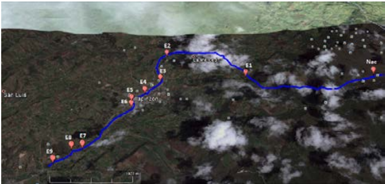
Figura 1. Estaciones de muestreo en la parte alta del río Bogotá. Villapinzón, Colombia.

Se seleccionaron nueve estaciones de muestreo entre el nacimiento del río Bogotá y 3km río abajo de la cabecera de Villapinzón. Las estaciones se ubicaron a lo largo del río de tal forma que la primera (E1) estuviera en una zona con poca intervención antrópica; la segunda (E2), después de los cultivos de papa, a 3km de la primera; la tercera (E3), a la entrada de Villapinzón; dos estaciones más (E4 y E5), dentro del casco urbano, a 780m y 1 230m de la entrada del municipio; la sexta (E6), a 290m de la cabecera municipal, antes de las curtiembres; la séptima (E7), en medio de los vertimientos de las curtiembres, a 2.2km de la cabecera municipal; la octava (E8), a 260m de la séptima, en el vertimiento de la curtiembre más grande del municipio, y la novena (E9), a 590m de la curtiembre (figura 1, tabla 1).