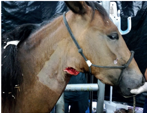
FIGURA 3. Incisión sobre el aspecto ventral de la vena linguofacial derecha para acceder a la bolsa gutural.

Una hora después de la cirugía se ofreció a la paciente heno y agua a voluntad y se observó una deglución normal. Pasadas 24 horas después del procedimiento, y guiado por endoscopia, en cada bolsa gutural se