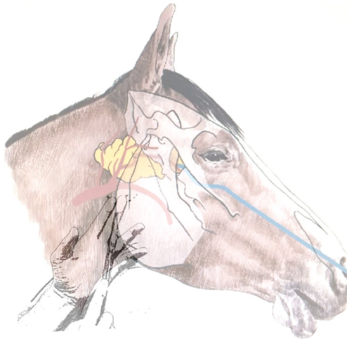
FIGURA 2. Abordaje quirúrgico de la bolsa gutural, posición de la tijera para acceder al piso de la misma. Se observa en color amarillo la bolsa gutural y en color azul el endoscopio.

Whitehouse modificado (Perkins et al. 2006a), el cual inició con una incisión de 10 cm ventral a la vena linguofacial entre el aspecto caudal de la rama vertical de la mandíbula y el músculo esternocefálico (Figura 2); posteriormente, se incidió la fascia que une la vena yugular y el músculo homohioideo para luego realizar disección roma profunda con ayuda de los dedos índices de ambas manos en dirección dorsal y rostral, dirigida hacia el piso del compartimiento medial de la bolsa gutural, de la misma manera que se accede para exponer la laringe al efectuar una laringoplastia (Rossignol et al. 2015). A continuación, se ejerció presión con el dedo índice en el piso del compartimiento medial de la bolsa gutural que a su vez era visualizada con el endoscopio, el cual se direccionó hacia caudal y ventral dentro del compartimiento hasta que se detectó su extremo con el dedo. Posteriormente, a través de la incisión se insertó una tijera Metzenbaum® con la punta cerrada para perforar el piso de la bolsa gutural (Figura 3), se amplió el orificio, sin retirar la