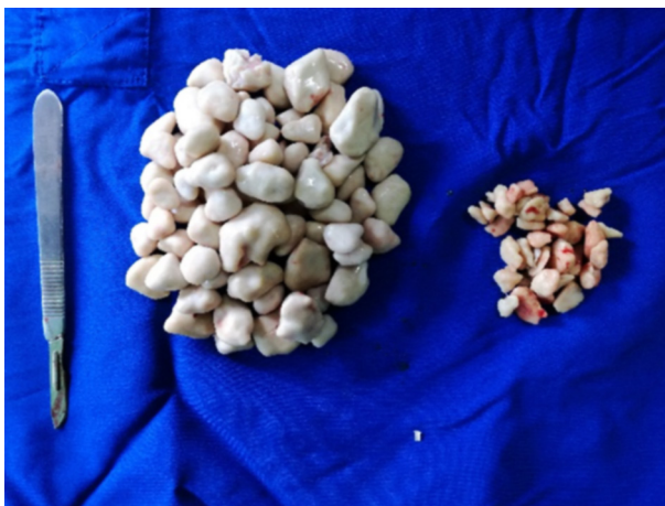
FIGURA 4. Condroides removidos quirúrgicamente de la bolsa gutural derecha e izquierda.