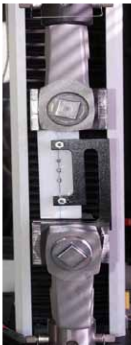
Figura 4. Equipo de medición Instron 3344 (Instron Corp, cantón, Mass) modelo 2519-106

This device was attached to the lower press of the Instron equipment, which is a fixed unit, and the acrylic plate was fastened to the upper press of the Instron, which is a mobile unit and slides in a vertical direction over the measurement device. A displacement of 8 mm was made for each model, with a speed of 5 mm/min (figure 6).