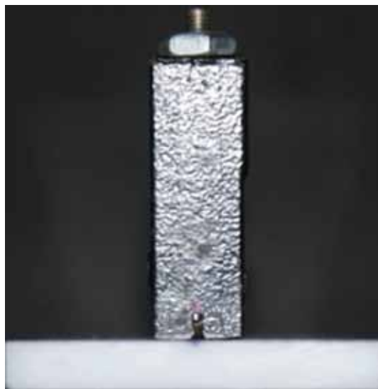
Figura 2. Dispositivo de alineación (vista frontal)