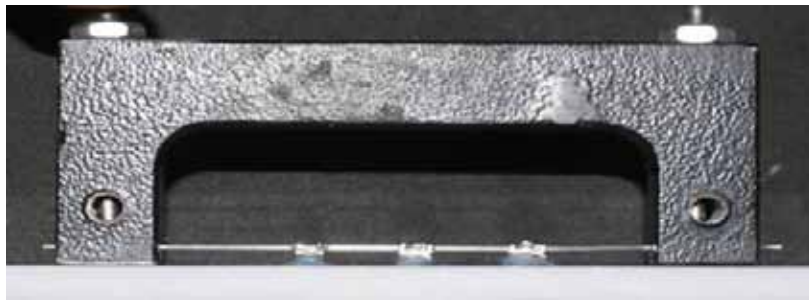
Figura 1. Dispositivo de alineación (vista lateral)

of 8 mm between them. They were bonded with self-curing resin (Prime-Dent VLC Orthodontic, Chicago, USA) using a device created for aligning the accessories to be evaluated, and eliminating all kind of active information that could be expressed. This device was adapted from the study by Plaza (2010), 23 especially designed for this purpose. It is made of a stainless steel body and a wire segment of 0.021 x 0.025" also made of stainless steel, parallel to the acrylic plate, which was inserted through the slots of all the bonded accessories in each plate in order to control bonding precision and to express the brackets prescription, thus allowing the archwire sliding in all the groups presenting the least possible SR at the time of measurement (figures 1, 2 and 3).