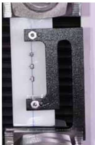
Figura 5. Dispositivo de medición