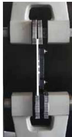
Figura 6. Dispositivo de medición, sujeto a la prensa del Instron