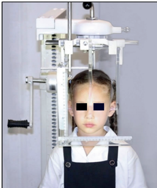
Figura 1. Cefalostato portátil

for this project included graph rulers framing the face of the patient in order to ensure a 1:1 ratio, as well as a metal base with a rack, a lever for leveling height, and wheels for transportation (figure 1).