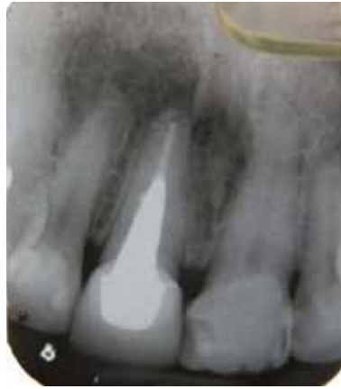
Figura 2. Zona radiolúcida circunscrita ubicada en el periápice del órgano dentario 11