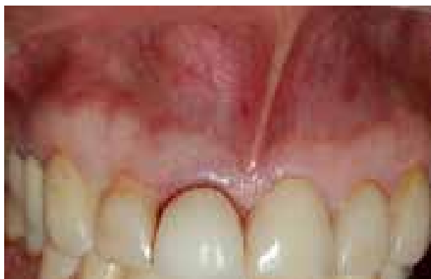
Figura 1. Lesión tumoral en zona vestibular a nivel del órgano dentario 11

(Figure 1) with no pain. The clinical examination showed a crown with cast core. The x-ray examination showed the presence of an endodontic treatment apparently well filled and a radiolucent periapical area extending to dental organ 12 (Figure 2). Treatment was explained and an informed consent was signed. Infraorbital anesthesia was applied reinforced with infiltration anesthesia of 2% lidocaine with epinephrine 1:80000. An internal bevel incision was made to raise a subperiosteal flap, performing full excisional biopsy of the lesion, which measured nearly 1 x 1 cm, followed by curettage of the surrounding areas to remove possible residues of granulomatous tissue, apicectomy and retrograde filling with MTA (Dentsply), which was prepared following the manufacturer's instructions (Figure 3). The histopathological study of the removed tissue showed a lesion covered by histiocytes with some neutrophils, macrophages, lymphocytes and plasma cells, showing compatibility with periapical granuloma wall (Figure 4). A 6-months post-treatment follow-up was conducted. The patient was asymptomatic and the radiographic examination showed repair of the radiolucent area at the apical end of the DO (Figure 5).