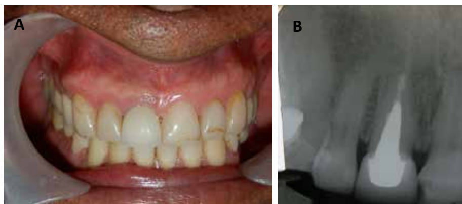
Figura 5. A: fotografía clínica de control a los 6 meses, donde se observa proceso de cicatrización finalizado. B: radiografía de control a los 6 meses; se observa zona radiopaca donde se encontraba la lesión, lo que indica formación de nuevo hueso sano.

Figure 5. A: Clinical photograph of follow-up after 6 months, showing completed healing process. B: control radiograph 6 months afterwards; a radiopaque area can be seen where the lesion used to be, suggesting the formation of new healthy bone.