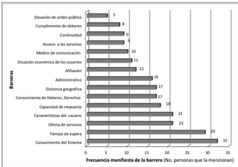
FIGURA 2. MEDELLÍN: BARRERAS AL ACCESO A SERVICIOS DE SALUD (PERSPECTIVA DE ACTORES)