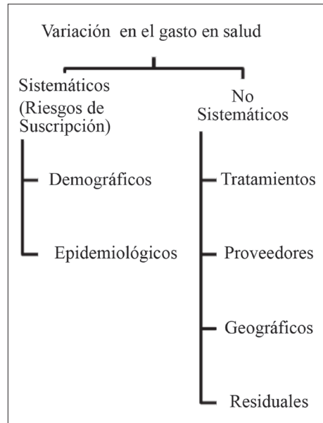
FIGURA 1. MAPA DE RIESGOS EN SALUD

elementos cruciales a la hora de determinar la manera en que diferentes factores convergen en la realización de un evento adverso. Por ejemplo, en el ámbito de riesgo crediticio en las instituciones financieras, el mapa de riesgos pretende identificar los factores que puedan tener una incidencia sobre el comportamiento de las exposiciones del portafolio y, sobre todo, las interrelaciones entre estos factores.