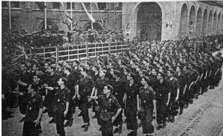
Imagen 1. Las juventudes cantarán el día de la Victoria, Zaragoza, marzo de 1945

Fuente: “Jóvenes del Frente de Juventudes marchando uniformados ante Franco el Día de la Canción por el Paseo Independencia de Zaragoza”, Combate. Órgano de las Falanges Juveniles de Franco , marzo, 1945.