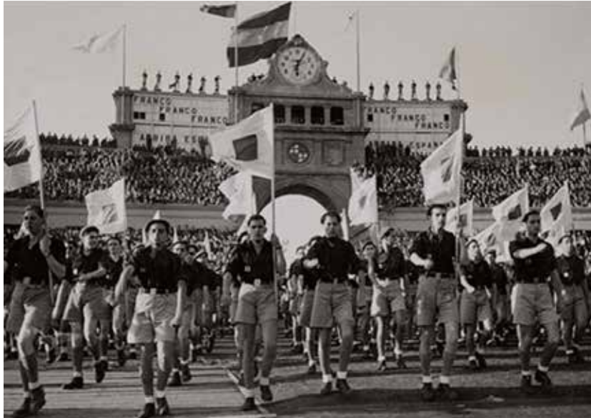
Imagen 2. Acto de demostración física y premilitar del Frente de Juventudes celebrado en el Estadio de Montjuïc