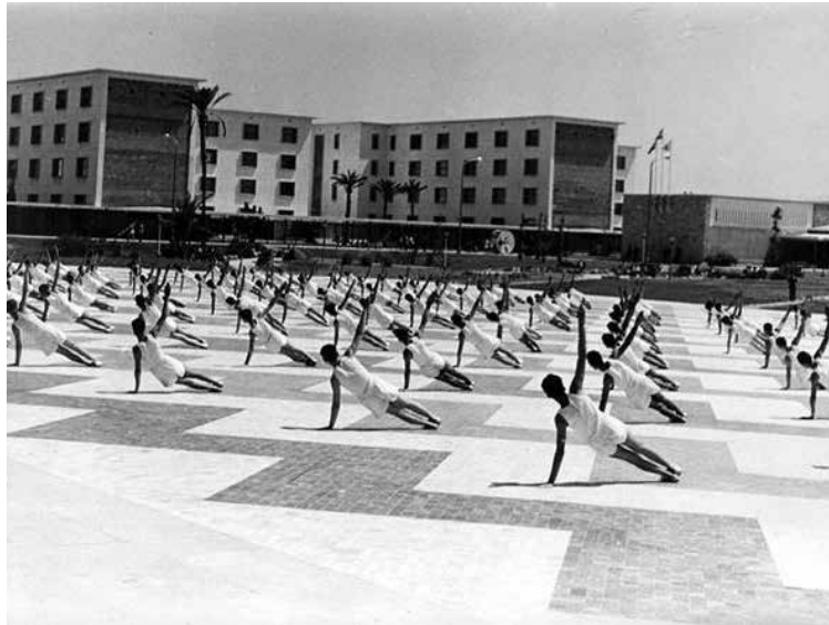
Imagen 3. Jóvenes practicando gimnasia en la Universidad Laboral de Tarragona