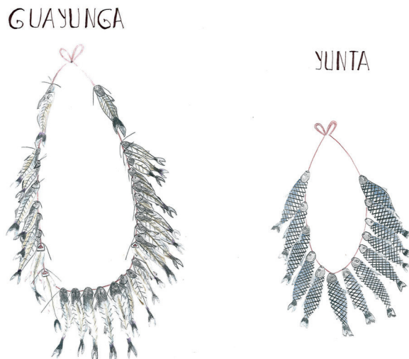
Imagen 6. El arte del comercio de pescado