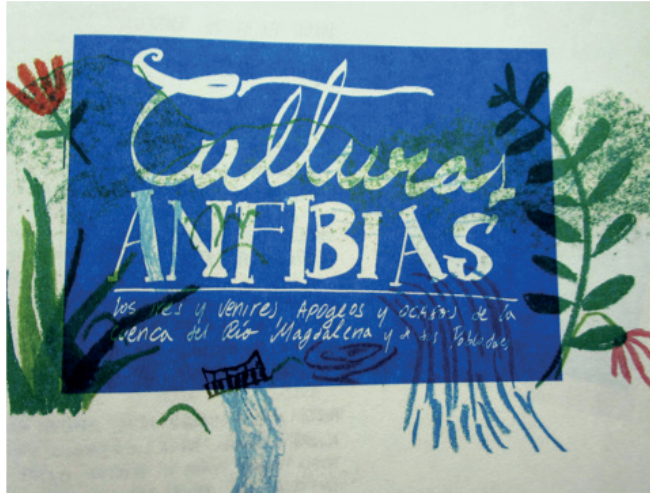
Imagen 2. Culturas anfibias: los ires y venires, apogeos y ocasos de la cuenca del río Magdalena y de sus pobladores

Fuente: Diana Bocarejo et al. , “Culturas anfibias; los ires y venires, apogeos y ocasos de la cuenca del río Magdalena y de sus pobladores”, Afiche, carátula de libro sonoro e imagen de la exposición en el Museo del Río en Honda , julio de 2016.