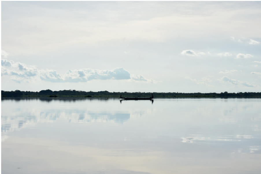
Imagen 1. Viviendo con el río, ciénaga La Rinconada