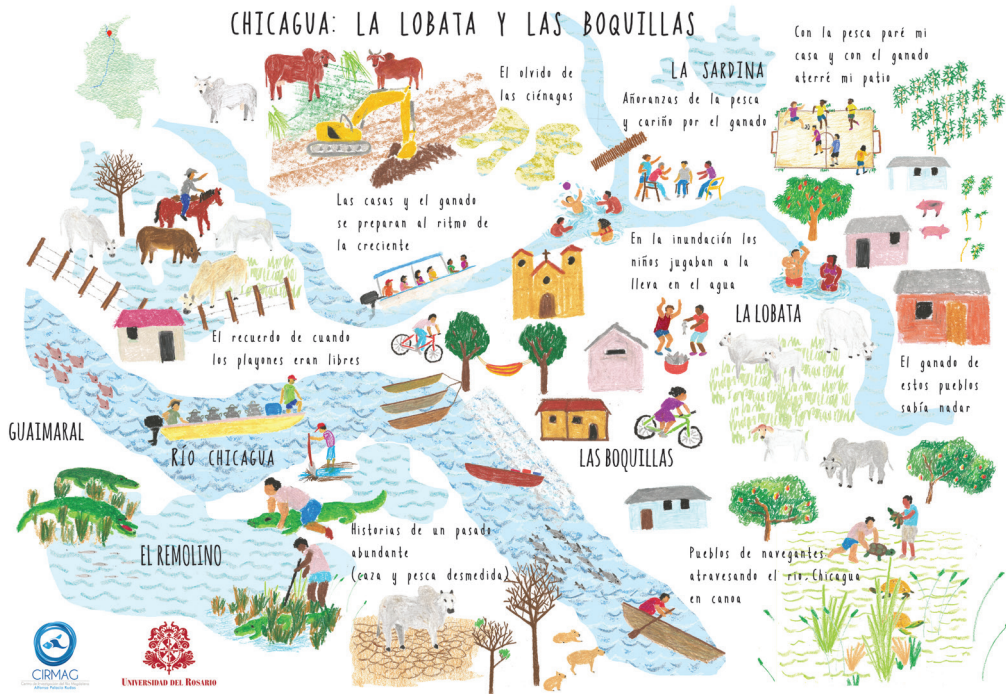
Imagen 3. Entre inundaciones y sequías: historias prósperas y crisis, 2016