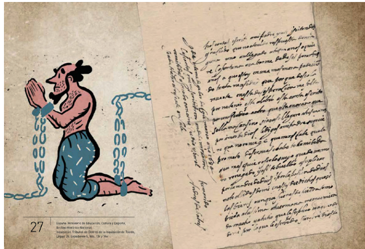
Imagen 1. Ficha n.º 27 del libro-juego Huellas de tinta y papel