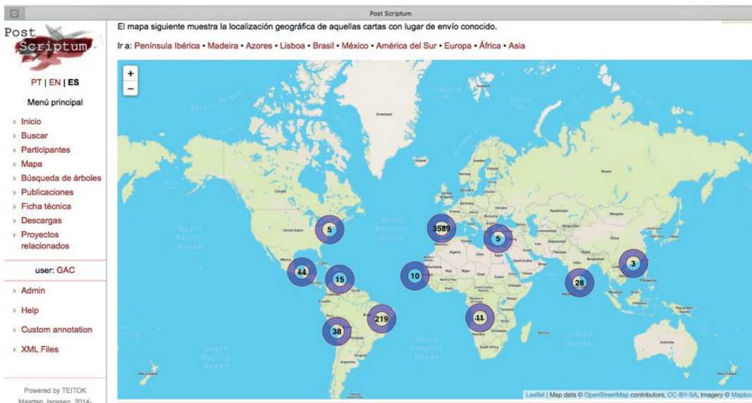
Imagen 2. Mapa virtual disponible en la web de Post Scriptum