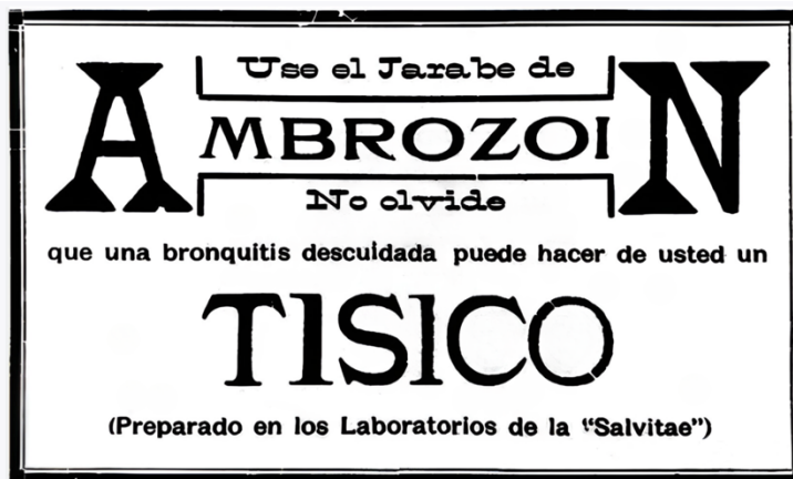
Imagen 2. Anuncio publicitario de medicamento de venta libre para prevenir la tuberculosis