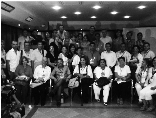
Asistentes II congreso internacional de educación. 15 años RUDECOLOMBIA. Vendimia V

cronogramas de los invitados internacionales, alojamientos y actividades en Santa Marta. Se realizaron reuniones con el Comité Coordinador, el 20 de mayo y 1 de agosto del 2011, donde se entregó en físico el presupuesto de VENDIMIA y el del Evento de los 10 años de RUDECOLOMBIA. Igualmente, se informó por escrito la experiencia de los cuatro eventos de VENDIMIA. Se trabajó con la persona contratada en la elaboración del video institucional, álbum digital y exposición fotográfica.