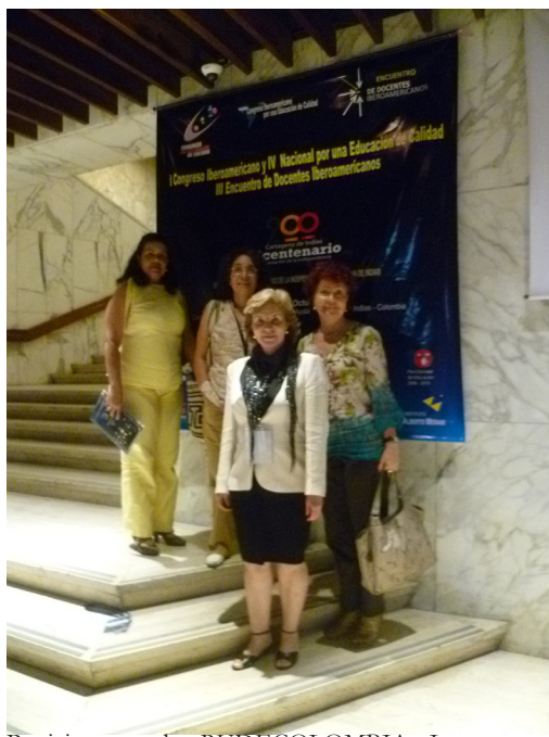
Participantes de RUDECOLOMBIA I congreso iberoamericano y IV Nacional por una educación de calidad III encuentro de docentes iberoamericanos