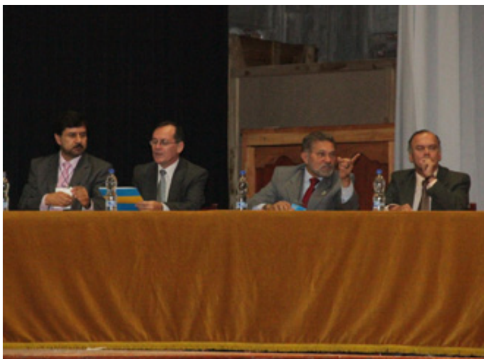
Mesa directiva VIII congreso internacional de la Sociedad de Historia de la Educación Latinoamericana

sociales y su complejidad en los tiempos, los docentes y los desafíos educativos y comunicación matemática y Tics; Textos escolares. Este último simposio recogió los resultados de la investigación titulada “La Independencia americana: textos, enseñanza e imaginarios escolares en Colombia y España”. Se destaca el Panel sobre “Género y Universidad” con participantes de Argentina, Cuba, España, México y Colombia.