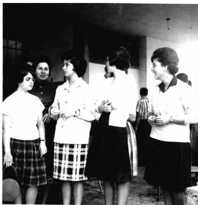
Presencia femenina en los inicios de la UTP