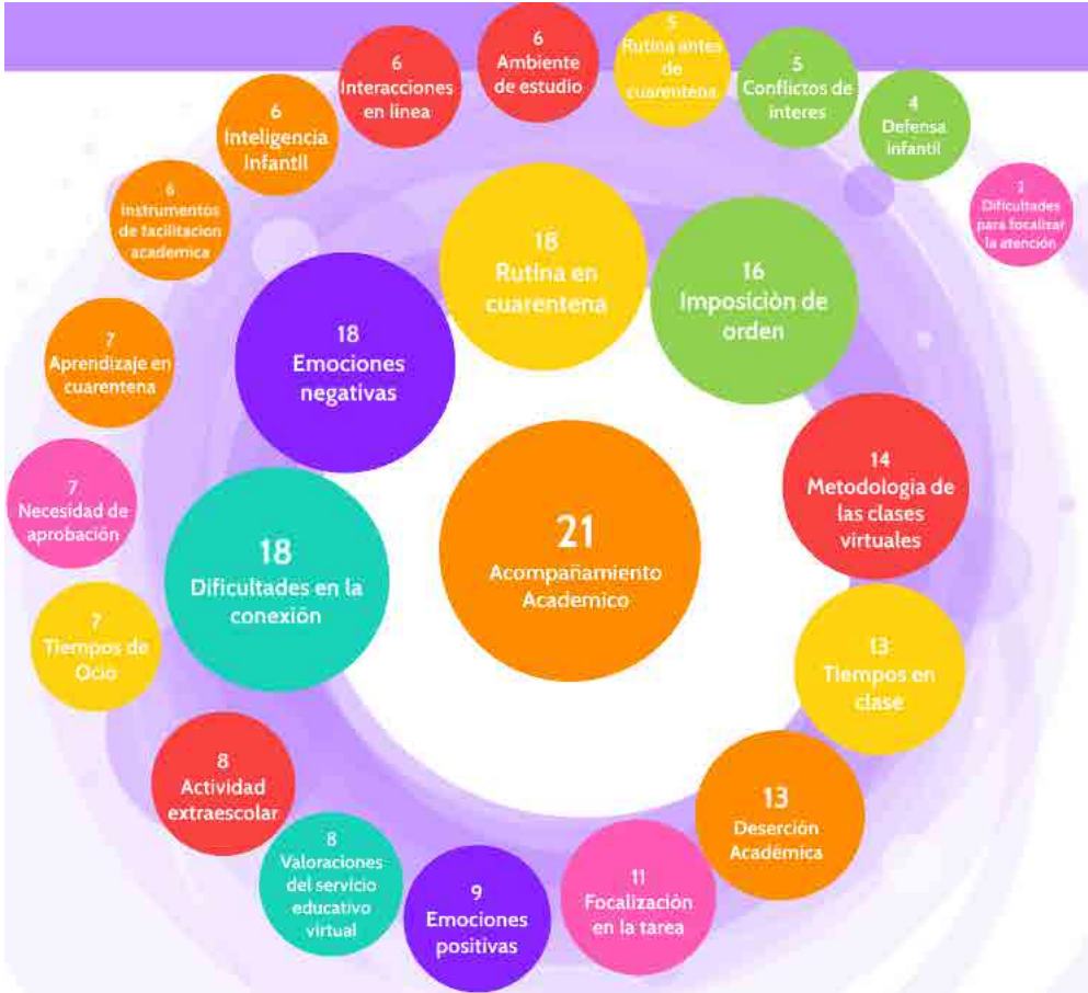
Figura 3. Diagrama Núcleo-Periferia de las RS de la Estrategia Aprende en Casa

elementos periféricos de la RS. El número que acompaña cada subcategoría corresponde a su frecuencia en la información recolectada.