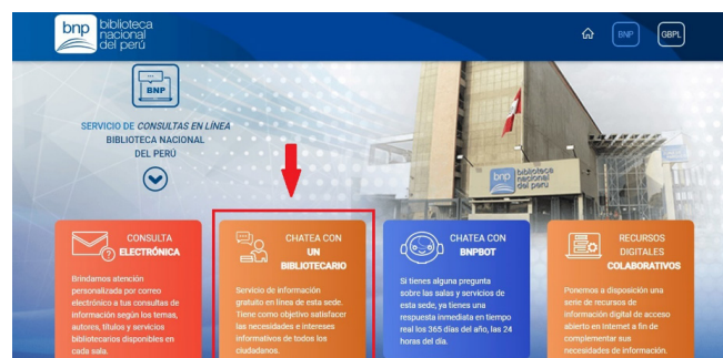
Figura 2. Servicio de chat en línea.

La BNP es una institución que tiene los recursos necesarios y que puede desarrollar fácilmente servicios digitales, pues cuenta con perfiles en las redes sociales Facebook, Instagram, Twitter y en las plataformas YouTube y Spotify; en ellas publica sus actividades con frecuencia. En esta última, se encuentran los podcasts sobre del ciclo de conservatorios “Lectura, Biblioteca y Comunidad”. Tiene una aplicación móvil de lectura “BNP Digital” por medio de la cual se accede a diversas publicaciones del patrimonio cultural de la nación. El servicio de consultas en línea se realiza mediante correo electrónico, bot y el servicio del referencista virtual “chatea con un bibliotecario” en un horario establecido (véase Figura 2). Realizan algunas actividades como el cinéforum BNP, charlas magistrales en historia sobre Perú, “Diálogos en tiempos de cambio”, conversatorios, cuentacuentos, entre otros.