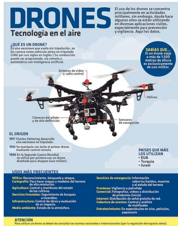
Figura 1. Drones: Tecnología en el aire.

En esta misma temática, el uso de drones es otra de las herramientas de la IA que, en el último año, está siendo aplicada con mayor frecuencia por los cuerpos policiales para la seguridad ciudadana (figura 1). Algunas de las ciudades que están implementando los drones para la vigilancia policial son México (Miguel, 2018), Barcelona (Llorca, 2018), Bogotá (Trujillo, 2019) y Nueva York (Simon, 2018).