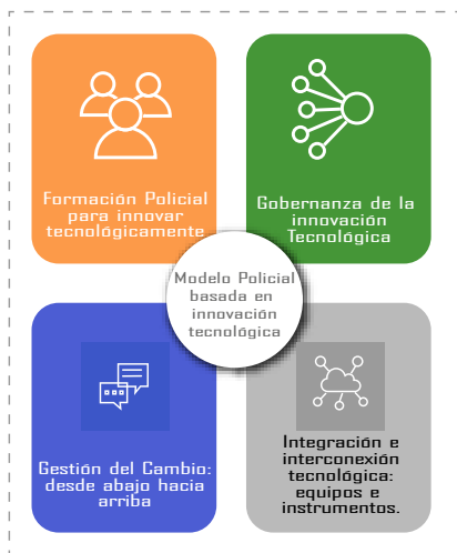
Figura 4. Propuesta del Plan de Acción para incluir la innovación tecnológica en materia policial de Fuerza Pública.

Igualmente, a raíz de la investigación realizada, se recomienda al cuerpo policial civil costarricense elaborar e implementar un plan de acción para incluir la innovación tecnológica en materia policial. Para este plan, se han identificado cuatro grandes componentes: la formación policial, la gobernanza, la gestión del cambio institucional y la integración e interconexión tecnológica que abarca desde herramientas hasta equipos tecnológicos (figura 4).