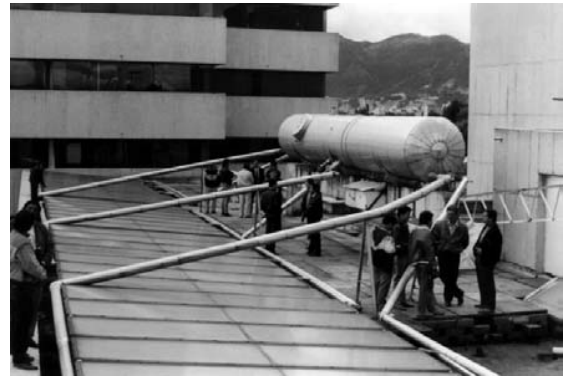
Figura 2. Calentador de la cafetería de la antigua Empresa de Energía de Bogotá (EEB). Construido en 1983 por el Centro Las Gaviotas (140 m 2 de colectores, tanque de 12 000 litros) y desde entonces en operación. Estudios previos para la EEB por la Universidad Nacional de Colombia.