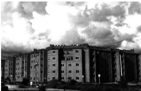
Figura 1. Vista parcial de los 1 250 calentadores solares instalados por el Centro Las Gaviotas a mediados de los ochenta en Ciudad Salitre, Bogotá, urbanización del Banco Central Hipotecario.

Si bien los calentadores solares para una pequeña familia costaban ya a mediados de los ochenta y noventa el equivalente a US$1000 por sistema (tanque de 120 litros, 2 m 2 de colectores solares) y representaban una inversión inicial medianamente alta, instituciones como el antiguo Banco Central Hipotecario, al hacer un análisis valor presente neto, comprendieron que era más económico emplear calentadores solares que emplear electricidad para calentar agua y obvió la inversión que harían los usuarios dotando a varias de sus urbanizaciones con estos equipos. Pero fue posteriormente la introducción de un energético más barato, el gas natural, la que desplazó del mercado esta naciente industria desde mediados de los noventa hasta la actualidad.