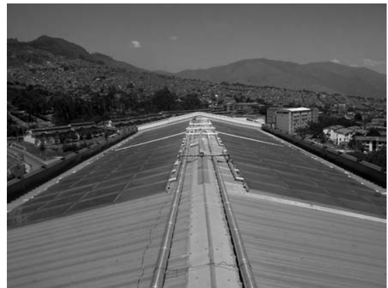
Figura 3. Colectores solares del Hospital Pablo Tobón Uribe, Medellín, en operación desde mediados de los ochenta (240 m 2 de colectores, tanque de 20 m 3 , no visible).

El desarrollo alcanzado hasta 1996 indicaba que se habían instalado 48 901 m 2 de calentadores solares, principalmente en Medellín y Bogotá, y en barrios con financiación del Banco Central Hipotecario [1]. La mayoría de los sistemas funcionaban bien pero algunos usuarios esperaban más de los sistemas, lo cual se ha entendido como que la demanda era superior a la capacidad de los mismos. No se han realizado nuevos estudios o evaluaciones sobre cómo se han comportado los sistemas instalados aunque se sabe, por ejemplo, que el calentador de la antigua sede de la Empresa de Energía de Bogotá lleva más de 25 años