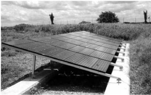
Figura 5. Sistema fotovoltaico de 3.4 kWp del Oleoducto Caño Limón-Coveñas. En operación desde hace más de 20 años.