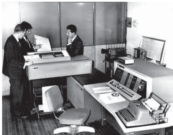
Computador IBM-1130.