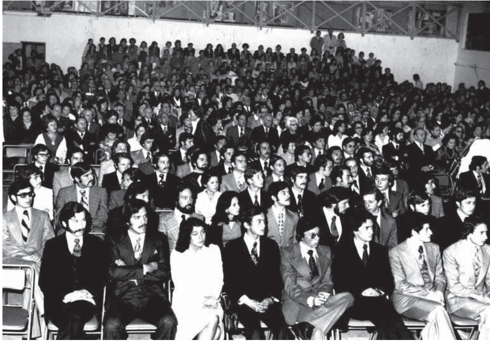
Ceremonia de graduación, 1970.