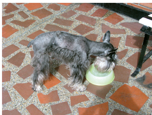
Figura 1. Canino de raza schnauzer presentado a la Clínica Veterinaria de la Universidad de La Salle, Bogotá (Colombia), con signos nerviosos debido a la presencia de Histoplasma spp.

En junio de 2010 fue presentado a la Clínica Veterinaria de la Universidad de La Salle, Bogotá, un canino macho de raza schnauzer de siete años (figura 1), con historia de presentación de heces fecales con sangre, depresión y orina concentrada. El propietario reportó además infección previa del paciente por Ehrlichia sp. , la cual fue tratada con doxiciclina y transfusiones sanguíneas por otro veterinario, ya que el paciente realizaba constantemente viajes al oriente colombiano.