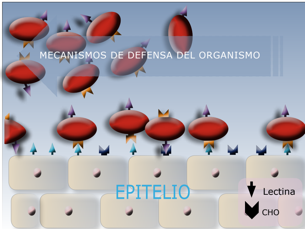
Figura 2. Receptores glicosídicos y lectinas en la bacteria y en el tejido que hacen parte de la adhesión bacteriana