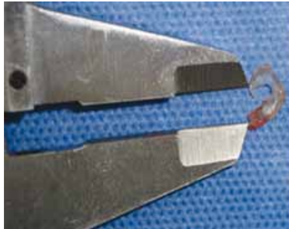
Figura 3. Medición con pie de rey del menisco medial de conejo de Gill