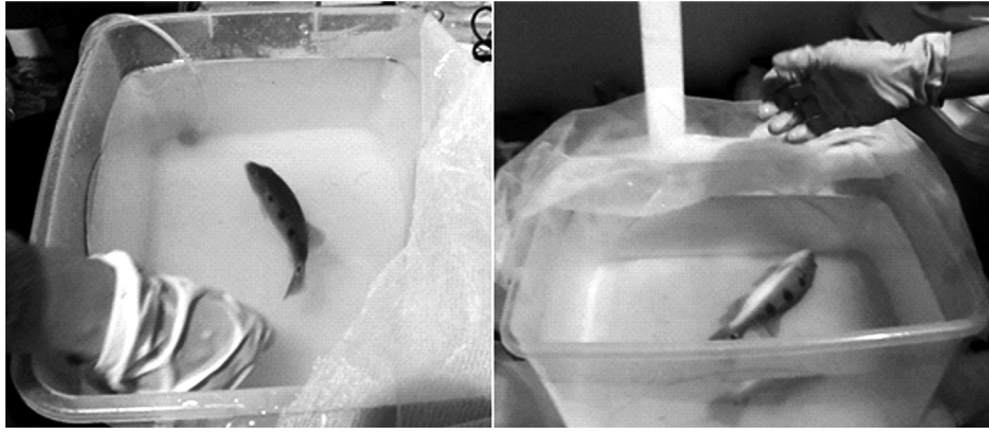
Figura 3. Ejemplar bajo inducción y bajo plano anestésico (30 mg/L).

2014), en híbridos de Pseudoplatystoma metaense X Leiarius marmoratus (50 mg/L),