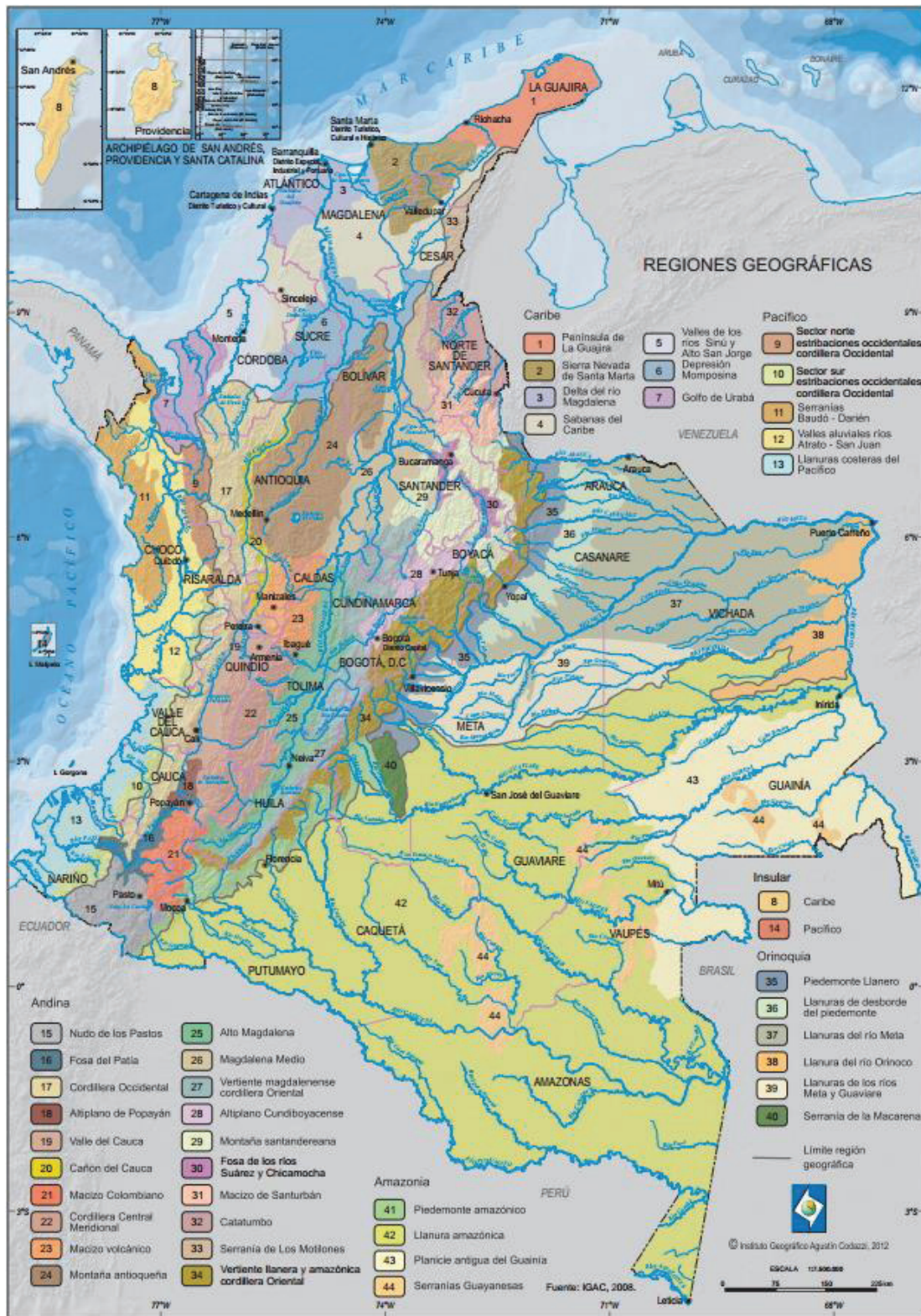
Mapa 2. Regiones geográficas (naturales) de Colombia. IGAC, 2012.