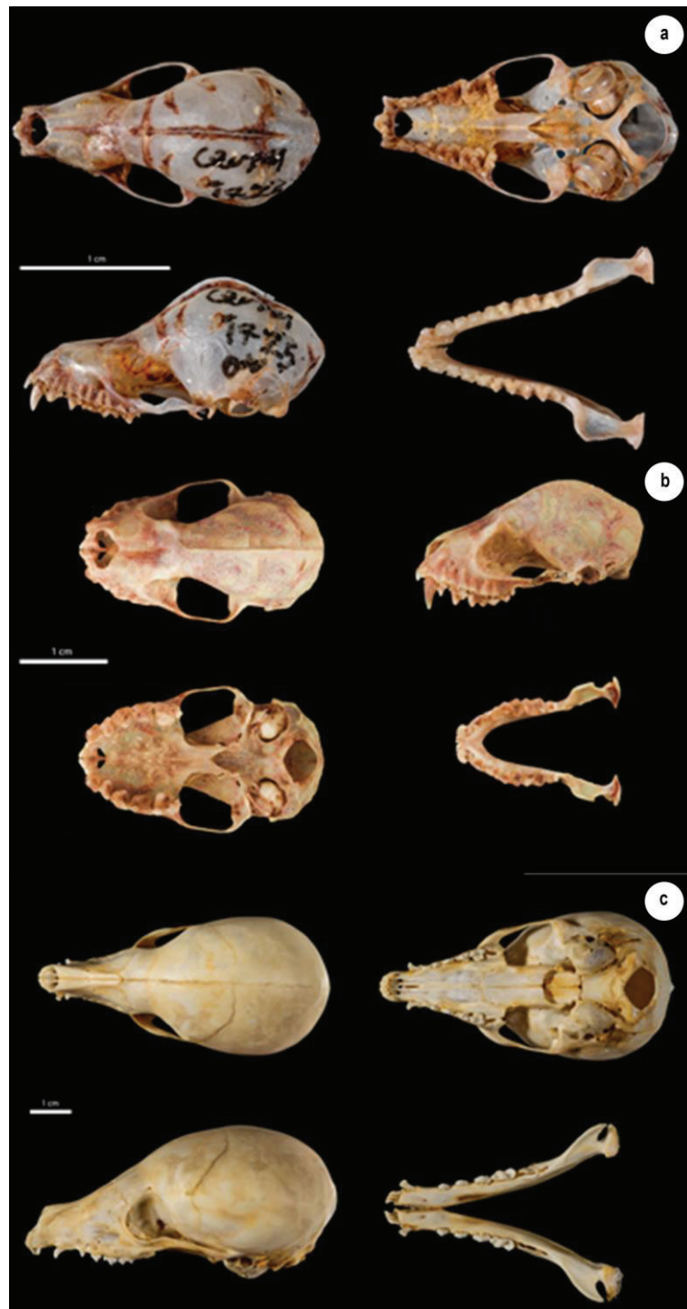
Figura 3. Vistas dorsal, ventral y lateral del cráneo y vista dorsal de la mandíbula. A) Micronycteris microtis (CZUT-M 1725); b) Platyrhinus infuscus (CZUT-M 0586); c) Nasnella olivacea (CZUT-M 0537). Barra de escala = 1 cm.

Desarrollo Científico y a los investigadores, quienes hicieron parte de la evaluación de la mastofauna del Tolima. A la Colección Zoológica de la Universidad del Tolima y Museo de Historia Natural Lorenzo Uribe Uribe S. J. de la Pontificia Universidad Javeriana, así como