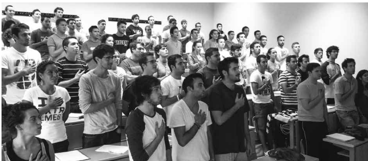
Imagen 1. Juramento de los Elegidos

Cada jugador cuenta con una credencial de