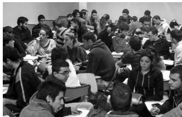
Imagen 3. Reflexionando y compartiendo soluciones

Una de las intenciones de la propuesta ha sido transmitir al alumnado la importancia de vivir la experiencia de aprendizaje, no como una asignatura finita en la que la meta es ella misma, sino como una experiencia de aprendizaje que realmente lo enriquezca y favorezca su proceso formativo. La construcción de valores desde la educación física se facilita a partir de propuestas de participación activa en las que se interactúa con los demás (Thorburn, 2014), se reflexiona y se buscan soluciones a los diferentes retos que son planteados conjuntamente (imagen 3). Este enfoque posibilita que el alumnado construya su aprendizaje a partir de la propia experiencia y sobre la base de un proceso profundo de reflexión (Kirk, 2013; Thorburn, 2014; Thorburn y MacAllister, 2013).