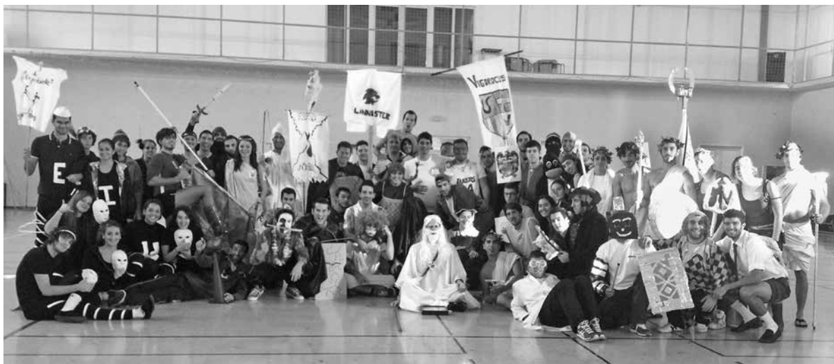
Imagen 4. Fiesta de la Concordia en La Profecía de los Elegidos