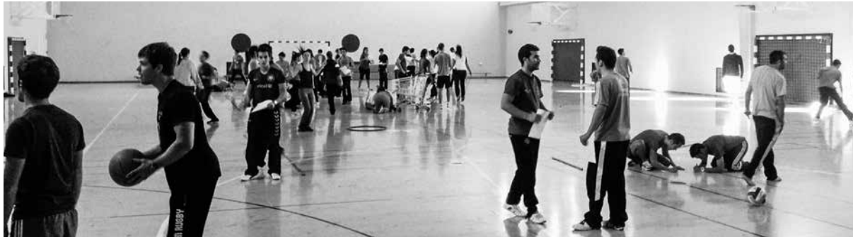
Imagen 2. Retos teórico-prácticos