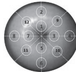
Figura 1. Secuencia de medidas.

Las medidas fueron realizadas en 12 zonas diferentes del cuello uterino siguiendo el orden que se muestra en la figura 1 . Los datos experimentales para cada zona de medición, fueron almacenados digitalmente.