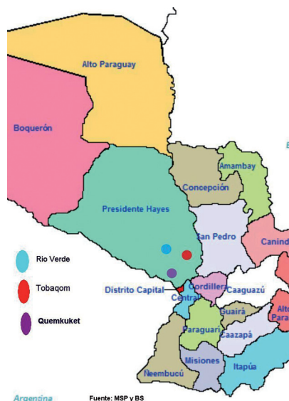
Figura 1. Mapa del Paraguay, Departamento de Presidente Hayes.

De las 81 mujeres indígenas estudiadas, 38 mujeres pertenecían a la comunidad de Qemkuket de la etnia Maká a (situada a 30 Km de la capital, Asunción), 20 mujeres a la comunidad de Río Verde (situada a 52 Km de la capital, Asunción) y 23 mujeres a la comunidad Toba-Qom (situada a 51 Km de la capital, Asunción), ambas comunidades pertenecientes a la etnia Toba-Qom . La Figura 1 ilustra el mapa del Paraguay, en el cual se encuentra el Departamento de Presidente Hayes, incluyendo las comunidades estudiadas.