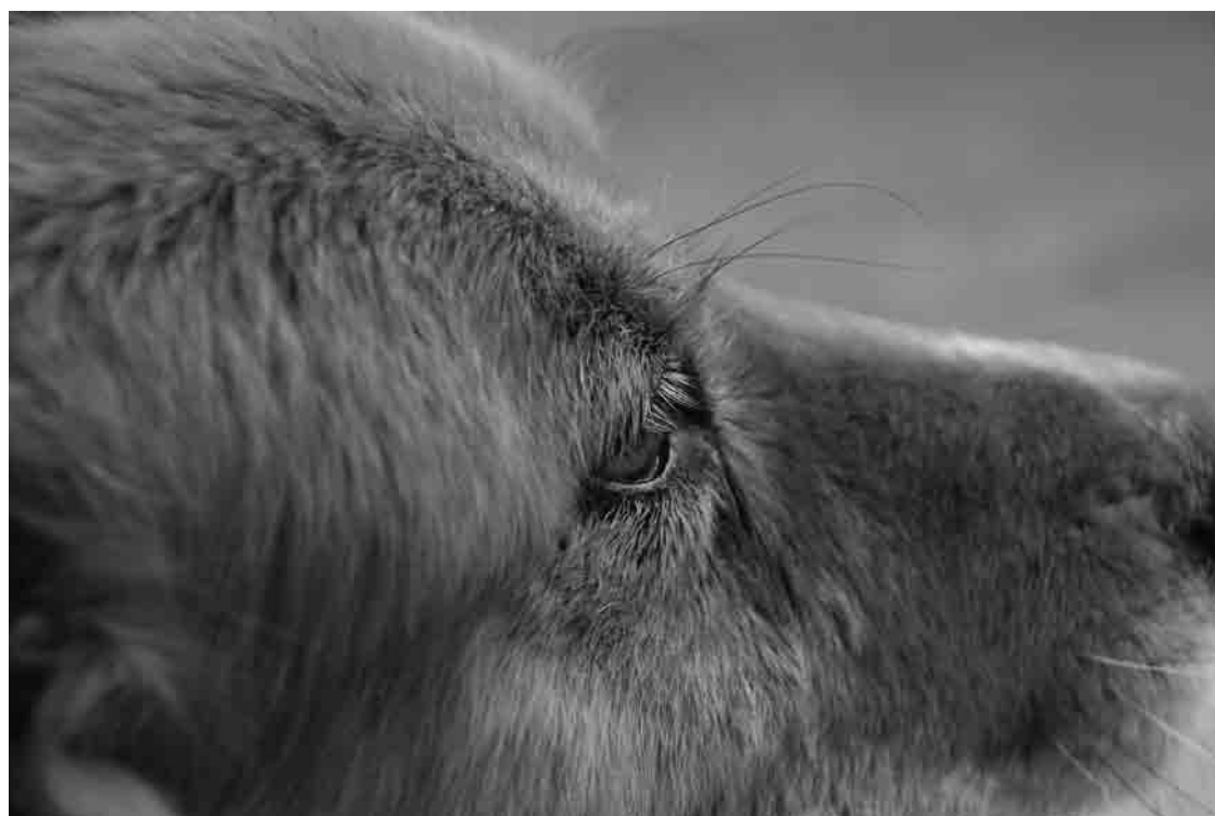
DANGER, PERRO CALLEJERO, 2008