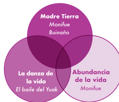
Figura 3. Concepciones de biodiversidad desde un nombrar propio

Las formas de enunciar y significar la biodiversidad desde el lugar de la cultura, muestran la importancia que para los participantes representan la vida y sus diversas manifestaciones en el contexto local. A continuación se explicitan las formas de nombrar la diversidad de la vida por parte de los futuros licenciados en biología de la etnia uitoto.