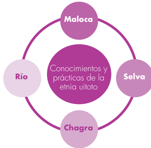
Figura 2. Escenarios de aprendizaje de la cultura uitoto-muruy