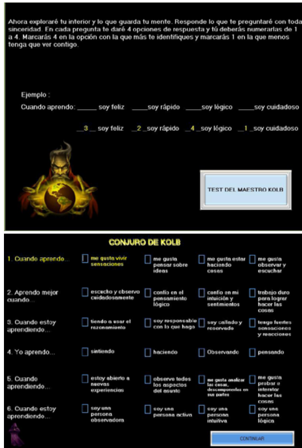
Figura 2. El modelo Kolb (1984), articulado al recurso educativo digital adaptativo “El rescate del reino”