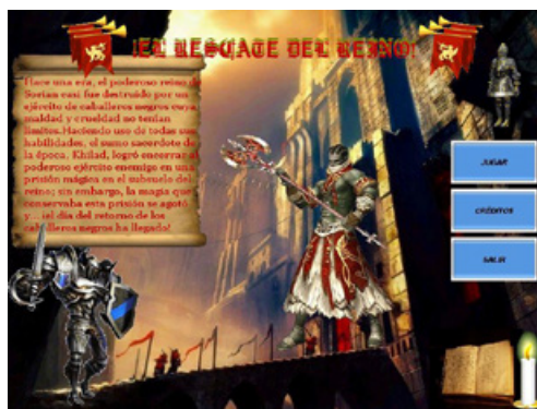
Figura 1. Ingreso al recurso educativo digital adaptativo “El rescate del reino”

Un factor clave por el cual surge esta estrategia didáctica se dio al identificar que al presentar a los estudiantes situaciones matemáticas de tipo algebraico, casi todos ellos buscan elementos e hipótesis de la aritmética, más no del álgebra; siendo este conocimiento una resistencia marcada por el uso de los símbolos al resolver problemas matemáticos.