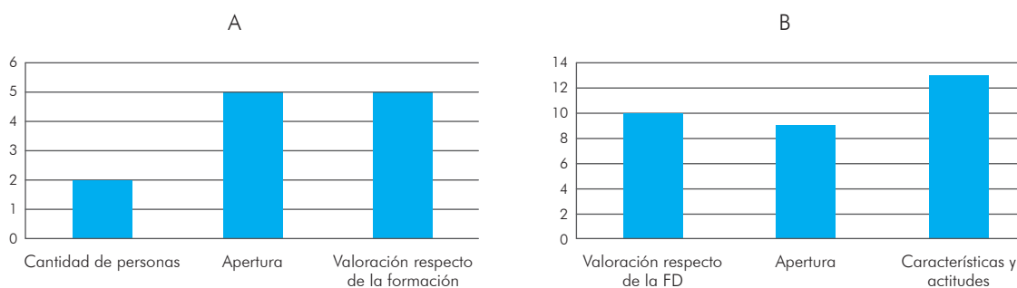
Gráfica 2. Distribución de frecuencias absolutas para las categorías de la frase incompleta La forma de trabajo en el laboratorio es... , para los grupos de docentes formadores (A) y docentes en servicio (B).

Por otra parte, en la gráfica 2B se destaca que los docentes en servicio mencionan principalmente características y actitudes positivas vinculadas a la forma de trabajo en el laboratorio, destacándolas como creativas, con buena organización, interesantes y entretenidas (“divertidas”, “con mucha motivación”, “lo que más les gusta a los estudiantes”). Las valoraciones negativas hacen alusión a actividades poco estimulantes (“tensionantes”, “aburridas”, “monótonas”). Otro grupo importante de respuestas se encuentra vinculada a una valoración de las prácticas con respecto a la formación docente, donde en algunos casos se las señala como adecuadas, y en otros como insuficientes, ya que son difíciles de aplicar en otras instituciones escolares (“excelentes”, “muy buenas”, “insuficientes, podrían ser mejor”, “no acordes con la situación que presentan los maestros en la escuela”). Por último, estos docentes señalan también la apertura de la forma de trabajo; destacan principalmente que la metodología de trabajo es tradicional, orientada al desarrollo de destrezas (“tradicional”, “protocolaria”, “la metodología lleva al estudiante a preocuparse más por cumplir que por aprender”, “se convierte en seguir una receta, no hay cabida para procedimientos diferentes a los planteados en el manual de laboratorio”).