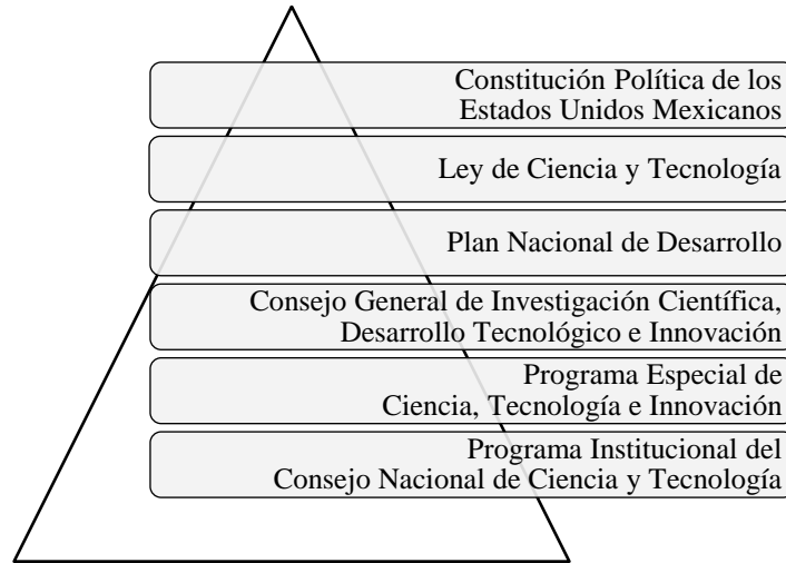
Entramado institucional de las acciones en ciencia, tecnología e innovación en México