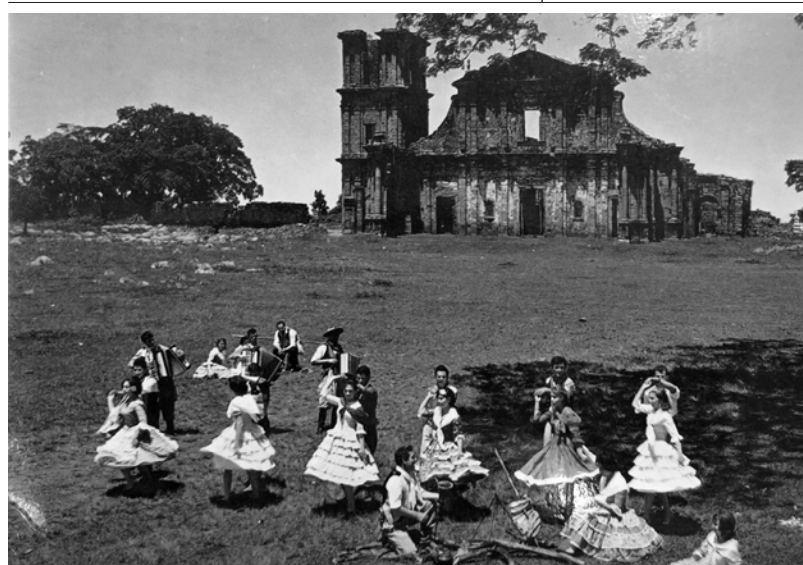
Figura 9. Cartão Postal. Brasil Turístico. Julho de 1966