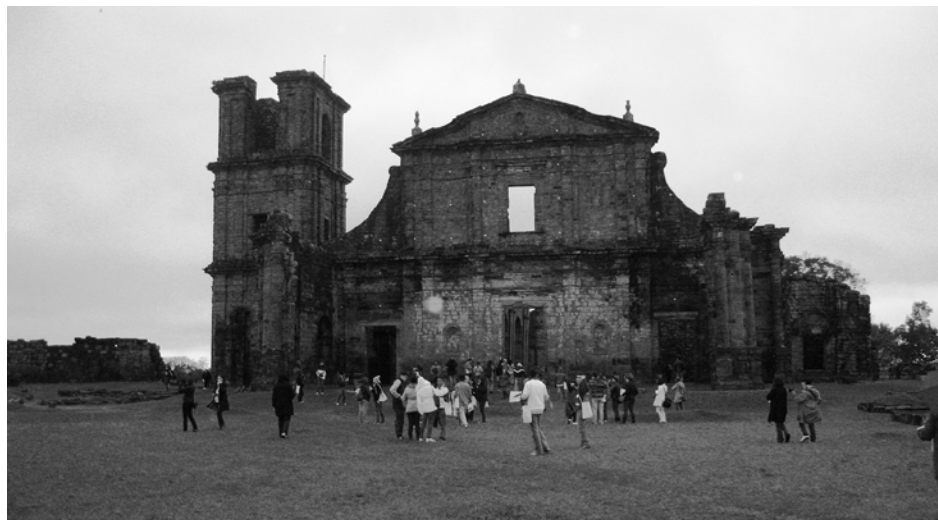
Figura 2. Igreja do Sítio Histórico de São Miguel das Missões – Rio Grande do Sul/Brasil

Fonte: Foto Darlan De M. Marchi. Julho de 2010.