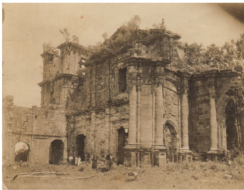
Figura 6. Imagem externa da igreja possivelmente no período das obras promovidas pelo governo do RS

Fonte: Fototeca do acervo do AHMACPS. Santo Ângelo/RS. Década de 1920. Fotógrafo: Kurt Michael.