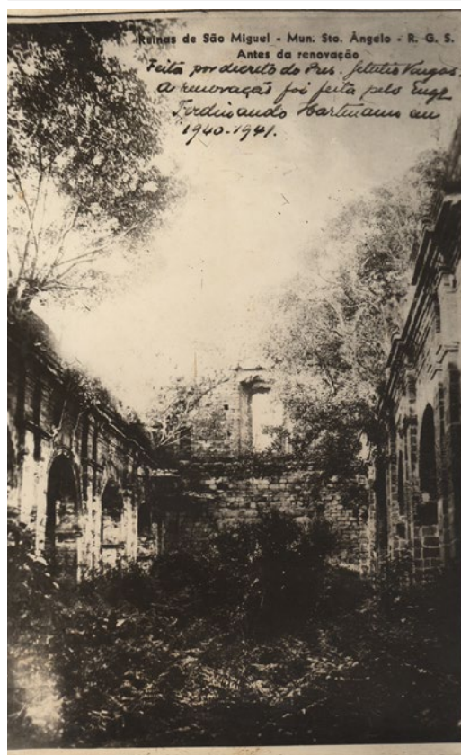
Figura 5. Imagem do interior da igreja antes das obras promovidas pelo governo do RS.

Fonte: Imagem da fototeca do acervo do AHMACPS. Santo Ângelo/RS. Década de 1920. Autoria desconhecida.