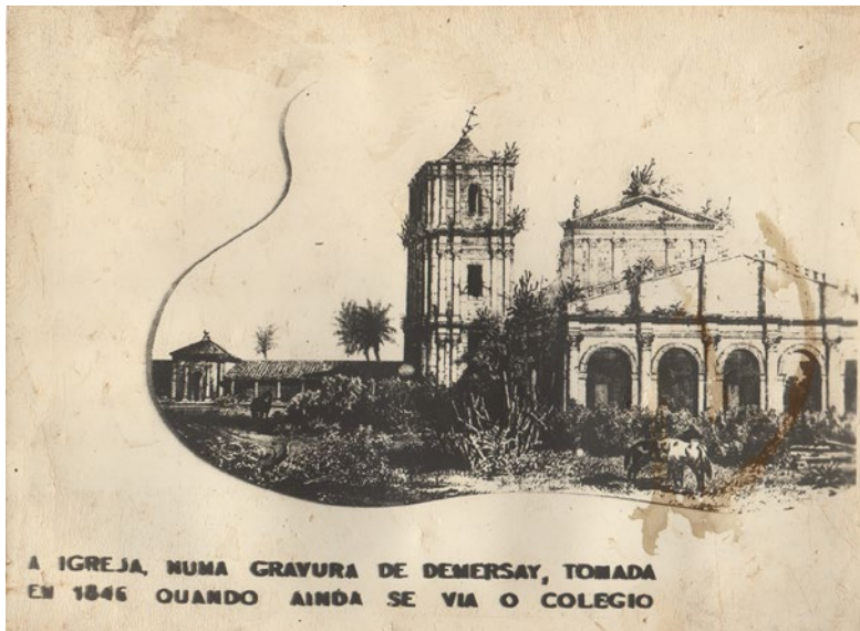
Figura 3. Reprodução da litografia de Alfred Demersay em cartão postal