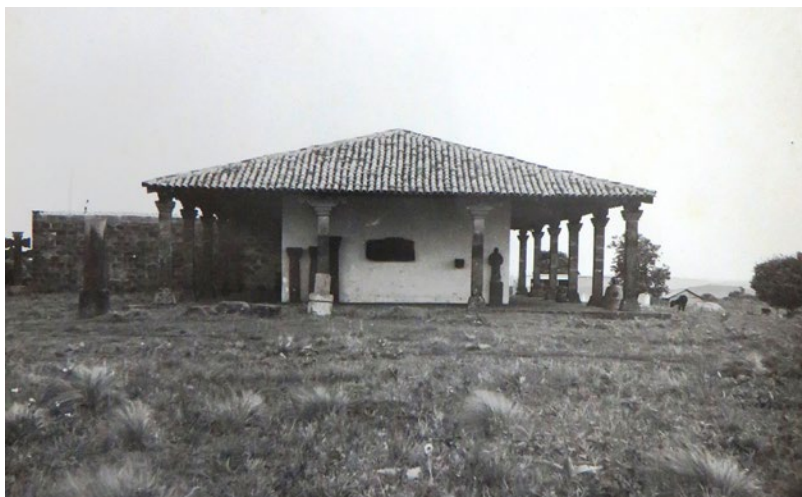
Figura 4. Museu das Missões em 1974. Vista da lateral. Levantamento Fotográfico