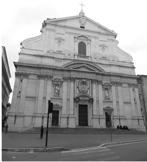
Figura 1. Igreja de Gesù – Roma/Itália

Março de 2014.