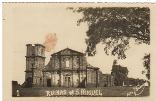
Figuras 7 e 8. Fotografias/postais de São Miguel das Missões. Entre as década 1940 e 1950

As fotos-postais com mais de seis décadas tornaram-se simbólicas, tendo seu enquadramento e imagens repetidos - salvo as poucas alterações na composição da paisagem - por inúmeras outras câmeras, e impressos em inúmeros outros postais turísticos e propagandas publicitárias. São exemplares da construção de um discurso patrimonial que tornam o sino, a árvore e a ruína em elementos pictóricos de uma obra, uma pintura que ultrapassa as bar-