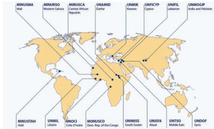
Figura 1. Operaciones del Mantenimiento de Paz de las Naciones Unidas

En este sentido, se trata de una articulación de la seguridad humana a fases posteriores a las intervenciones, con el fin de proteger y empoderar poblaciones vulnerables, como ocurrió en Lybia, donde la intervención de 2011 habría significado una reorientación de la responsabilidad de proteger hacia la emancipación y la agencia de su población (Chandler, 2012), aunque como se muestra en casos como los de Cambodia y Myanmar, solo reprodujo