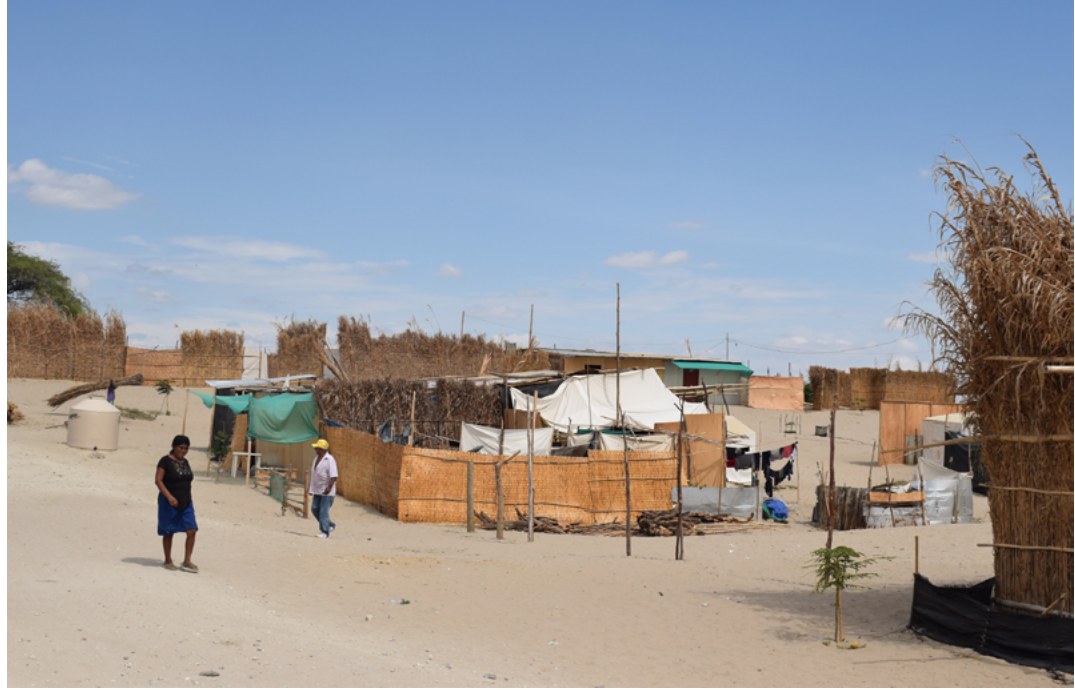
Figura 5. Nuevo Santa Rosa de Cura Mori

Fuente: M. Burneo, marzo de 2018 (a un año del desborde del Río).