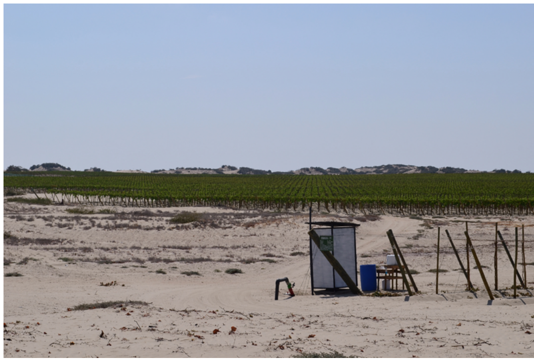
Figura 2. Agroindustria en expansión, colindante con las tierras comunales para futuros asentamientos entregadas a moradores de Santa Rosa

17 Las afirmaciones realizadas en este párrafo sobre la empresa, la asociación de moradores y el Frente de Defensa de las tierras se basa, por un lado, en entrevistas a profundidad realizadas a la presidenta de la asociación de moradores, al principal líder de Nuevo Santa Rosa y al presidente del Frente de Defensa. Y, por otro lado, en un conjunto de observaciones y conversaciones informales sostenidas con comuneros y comuneras en 2016 en el caserío de Santa Rosa de Cura Mori, así como una reunión sostenida con la Junta Directiva en la sede oficial de la comunidad campesina, en el pueblo de Catacaos. Los nombres han sido omitidos por protección de los entrevistados.