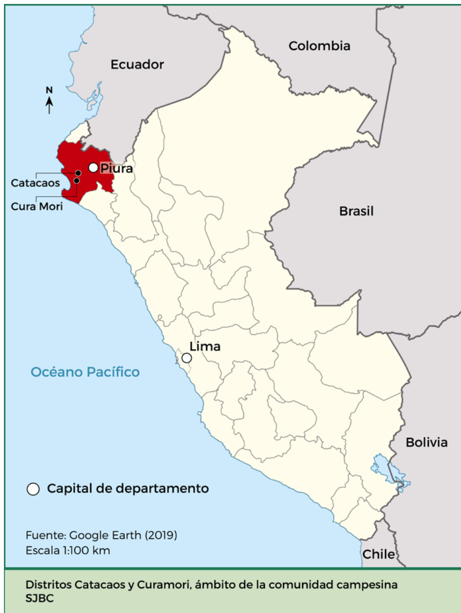
Figura 1. Mapa de Perú, departamento de Piura y distritos de Catacaos y Curamori

← 4 Catacaos es uno de los cinco distritos del Bajo Piura que se superponen al ámbito de la comunidad SJBC. Su origen se remonta a 1547, año en que se construyó el templo católico San Juan Bautista de Catacaos en tierras de los curacazgos de la etnia tallán. Durante la colonia, Catacaos fue la parroquia del pueblo de reducción de indios. Luego de la independencia, en 1825, Catacaos fue reconocido como distrito por decreto de Simón Bolívar. Actualmente cuenta con 75 870 habitantes.