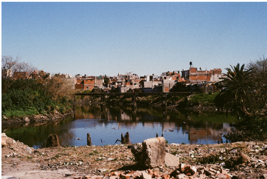
Figura 2. Ribera de la Villa 21-24 de Barracas en la ciudad de Buenos Aires

El PISA tuvo más de diez líneas de acción que abordaron la complejidad de la problemática ambiental de la cuenca. Entre ellas encontramos las de “contaminación de origen industrial”, “saneamiento de basurales”, “ordenamiento ambiental del territorio”, “liberación de márgenes y camino de sirga”, “urbanización de villas y asentamientos precarios” y “expansión de la red de agua potable y saneamiento cloacal”. Una parte importante de las acciones delineadas en el plan (en particular las nombradas) tenían por objeto los asentamientos informales localizados en la cuenca y sus habitantes y, en especial, aquellos radicados en la ribera a lo largo del río. Las políticas vinculadas a