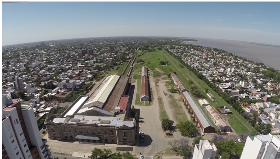
Figura 3. Cuadro de la estación Belgrano