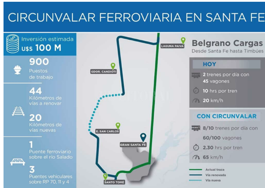
Figura 2. Circunvalación ferroviaria