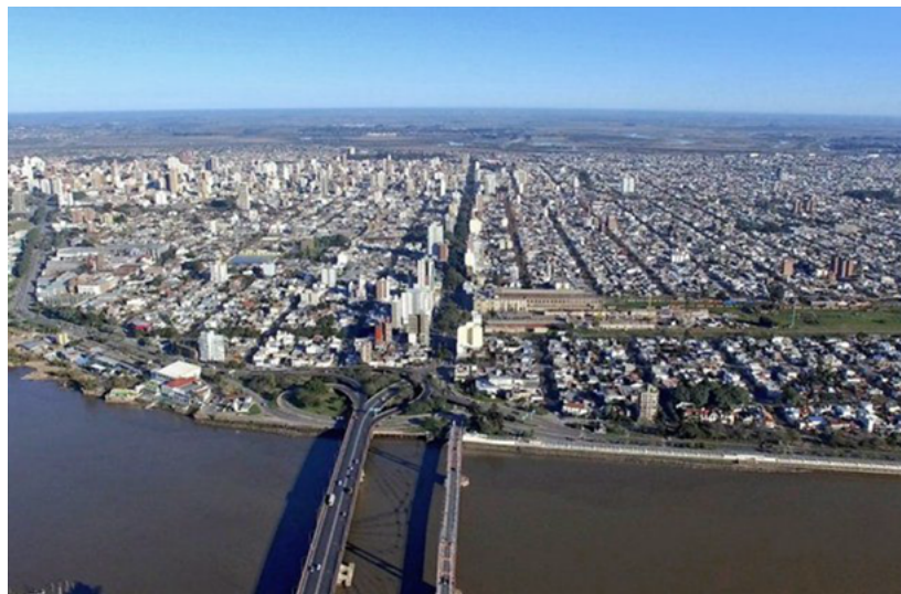
Figura 5. Construcción de torres en las inmediaciones de la ex estación Belgrano