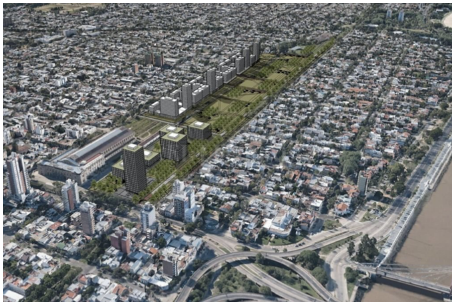
Figura 4. Proyecto de urbanización para el cuadro de estación