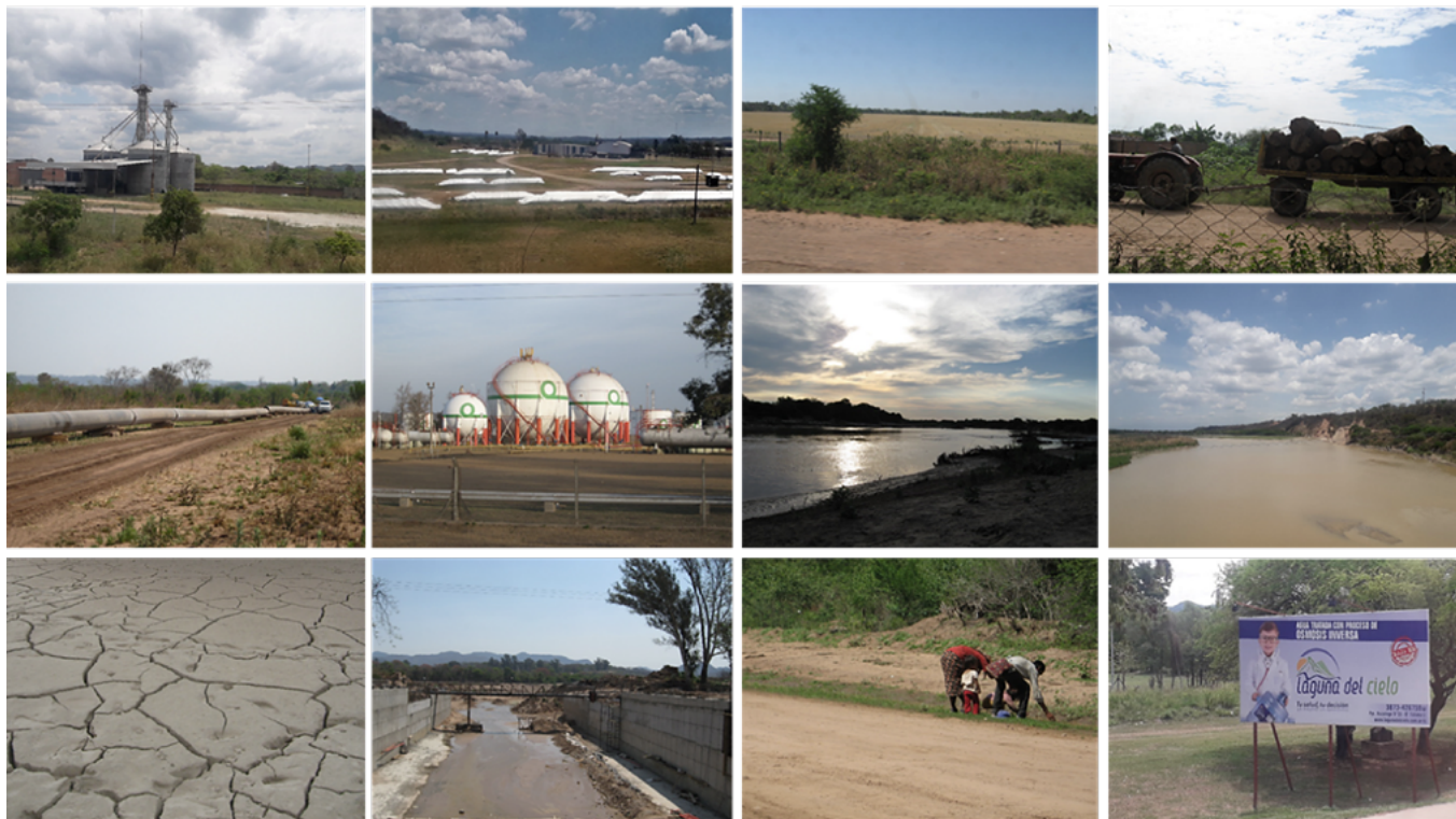
Figura 1. Chaco salteño, territorio hidrosocial