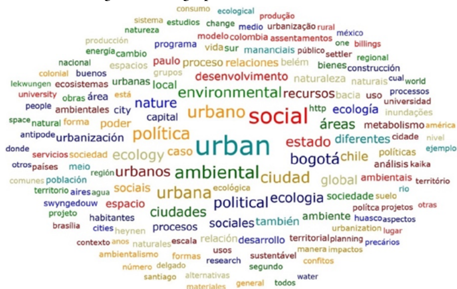
Figura 2. Ecología política asociada a lo urbano

Las figuras nos ilustran un eje matizado de divergencia en términos de ocurrencia en el uso de ciertas categorías. En