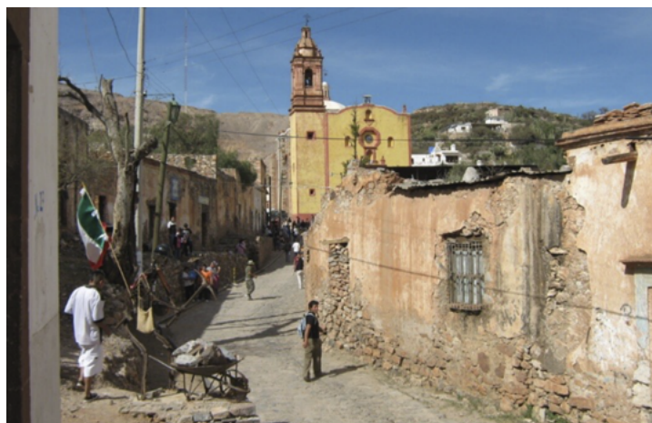
Figura 5. Vista de la imagen urbana