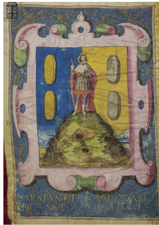
Figura 1. Escudo de Armas de la Ciudad de San Luis Potosí de 1656