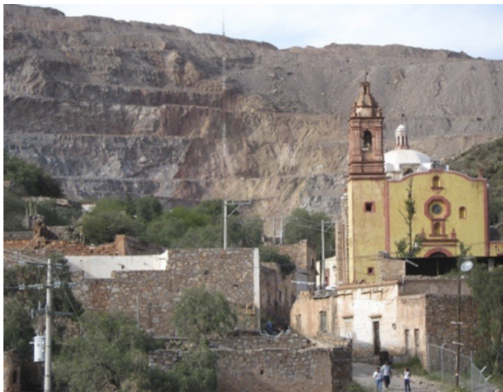
Figura 2. Cerro de San Pedro

Su emplazamiento y adaptación a la topografía definen la morfogénesis de su apropiación territorial (figura 4) y, sobre esta, se ensayan las primeras propuestas humanas de distribución funcional (figura 5), entendiendo que se parte de los intereses del grupo social dominante sobre los yacimientos argentíferos (Arista Castillo, 2010). Los reales de minas fueron los