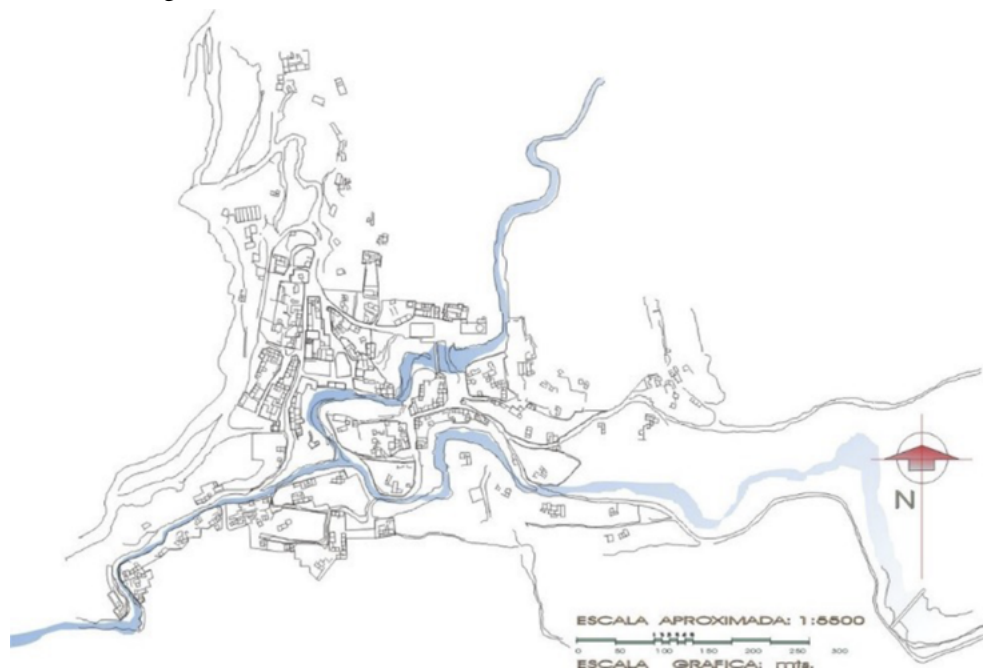
Figura 4. Plano de la estructura urbana del Cerro de San Pedro