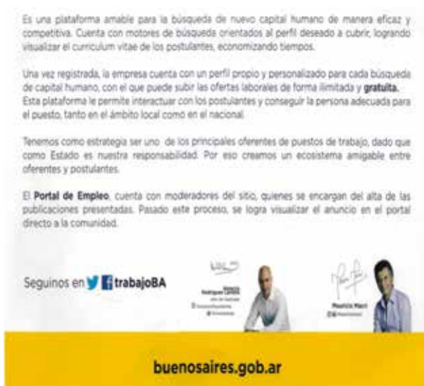
Figura 3. Portal de Empleo 2