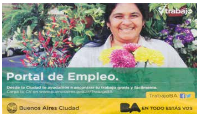
Figura 4. Portal de Empleo 3