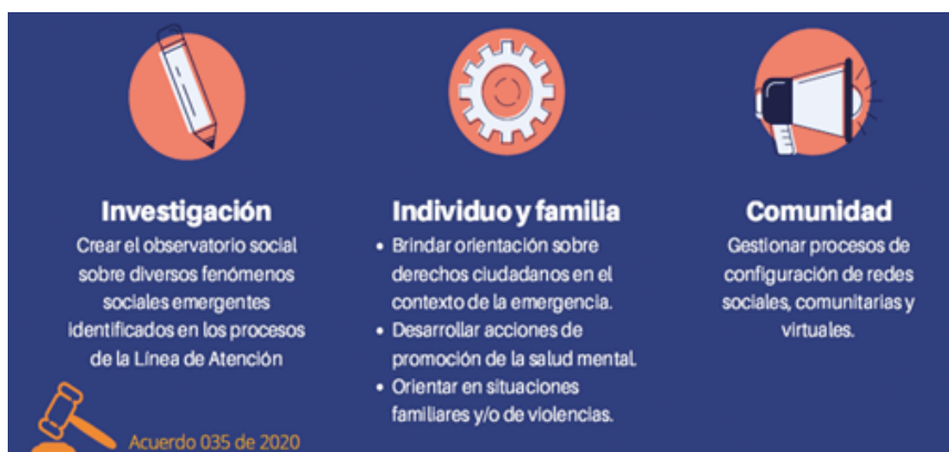
Figura 2. El alcance de Unicolmayor Te Escucha.