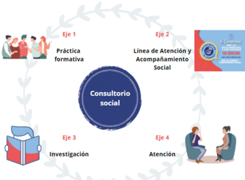
Figura 1. Estructura del consultorio social del programa de Trabajo Social.