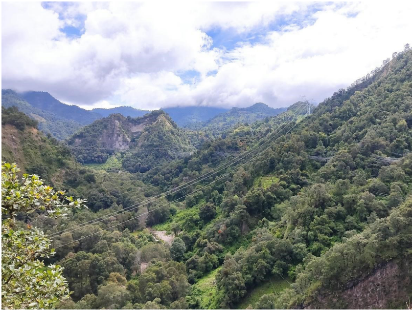
Figura 3. La zona de Amatzinac vista desde el puente de los comuneros y ejidatarios. Se pueden apreciar varias mangueras colocadas en las alturas