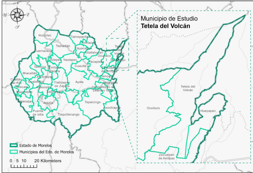
Figura 1. Ubicación del municipio de Tetela del Volcán