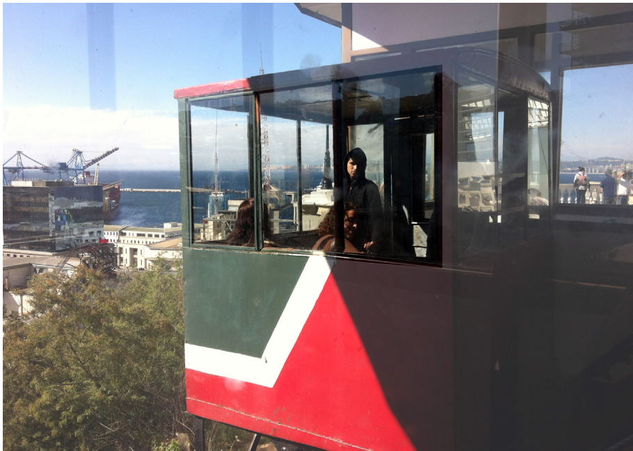
Figuras 1 y 2. Viajeros en el ascensor El Peral, cerro Alegre