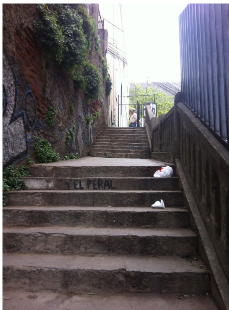
Figuras 9 y 10. Escaleras San Agustín y El Peral en cerro Alegre

En este tipo de viaje, los habitantes adaptan su horario de acuerdo a los momentos que significan como seguros, y la ciudad se restringe a los horarios en los que los medios de transporte funcionan y a los tiempos de viaje comunes con sus vecinos. La significación del espacio público es negativa y por tanto se evita su uso, revelando una falta de apropiación territorial de las escaleras, que se ve acentuada por tener caminos intrincados y estrechos, deteriorados físicamente, donde además de encontrar peldaños en malas condiciones, se pueden apreciar desechos como botellas y latas de cerveza vacías, colillas de cigarro y malos olores.