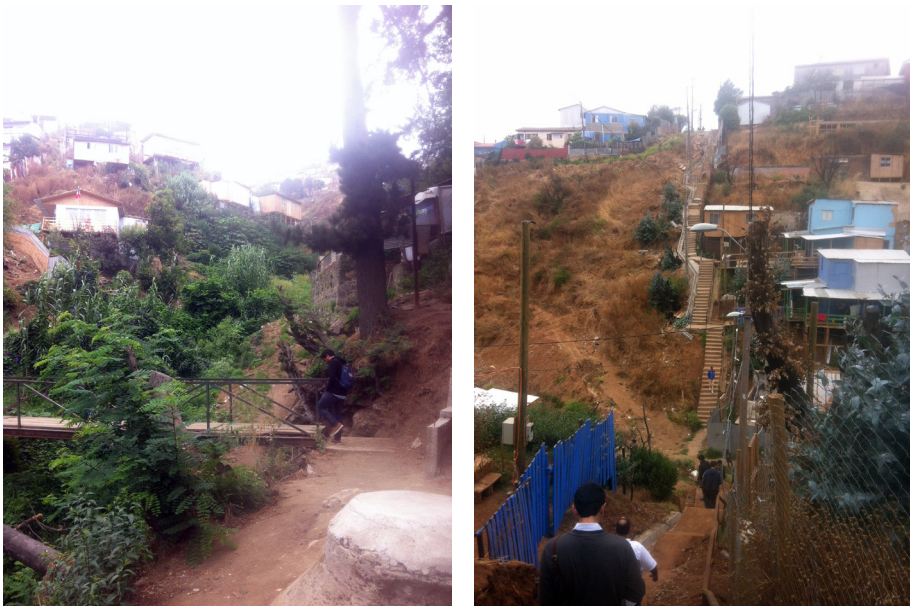
Figuras 7 y 8. Entorno rural en cerro El Litre. Interior de la quebrada Polcuro, entre cerros Las Cañas y El Litre. Escalera Picton, cerro El Litre

los colectivos van copados, porque la locomoción “ se la pelean ” entre varios cerros. Es por eso que, en muchos casos, debe subir el cerro en un colectivo del cerro La Cruz hasta el punto de partida de los colectivos del cerro El Litre, y de ahí tomar un taxi de ese recorrido para que los lleve a su destino, ya que es la única línea que pasa por el consultorio (ver figura 6). Esto se hace porque tomar un colectivo de bajada desde el cerro La Cruz “es un drama”. 16 Esta “pelea” por el colectivo se une a que a los adultos mayores les cuesta moverse, y con eso “la gente se amarga”, 17 debido al bajo mantenimiento de pasajes y escaleras angostas, que “en invierno son de puro barro”. Además, se observa que los espacios se encuentran deteriorados y con baja inversión en terminaciones, y que existe un entorno mayormente rural (ver figuras 7 y 8).