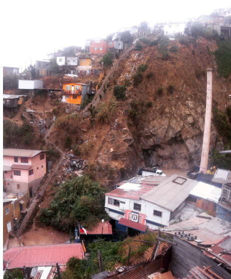
Figuras 3 y 4. Ascensor Reina Victoria, que sirve a cerro Alegre, y sitio en que se ubicaba el ascensor Las Cañas junto a la escalera de la muerte, cerro Las Cañas