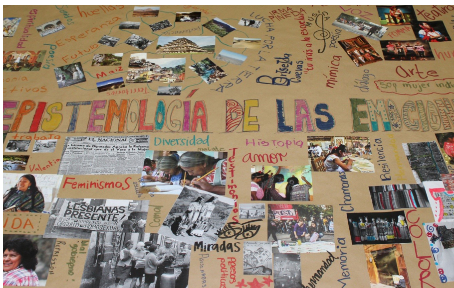
Figura 3. Taller “Cuerpo, género y feminismos”, Centro de Investigaciones y Estudios de Género, UNAM-México

palabras, el feminismo involucra una respuesta emocional “que implica una reorientación de nuestra relación corporal con las normas sociales” (259). En los talleres trabajamos con las emociones que Ahmed considera como forjadoras de vínculos feministas: la indignación frente a las injusticias, el dolor 24 como efecto de diferentes formas de violencia, el amor, el deseo y la alegría en las redes con otras mujeres, el asombro que siente lo ordinario como sorprendente y la esperanza que estructura el deseo de cambio, como apertura pensable hacia lo posible. Uniendo los dos ejes de los talleres, reflexionamos también sobre cómo las emociones moldean cuerpos y objetos. Y siguiendo a la misma autora, en lo que ella denomina “sentimientos queer”, abordamos el potencial epistémico de la incomodidad o desorientación y, a la inversa, el potencial de ignorancia del confort o la comodidad 25 (especialmente respecto a los conocimientos encarnados).