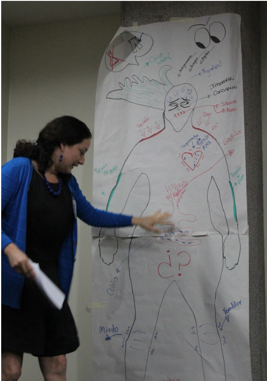
Figura 2. Taller “Experiencias corporales, comprometidas y reflexivas en investigación activista”, Congreso Iberoamericano: Ciencia, Tecnología y Género: San José, Costa Rica