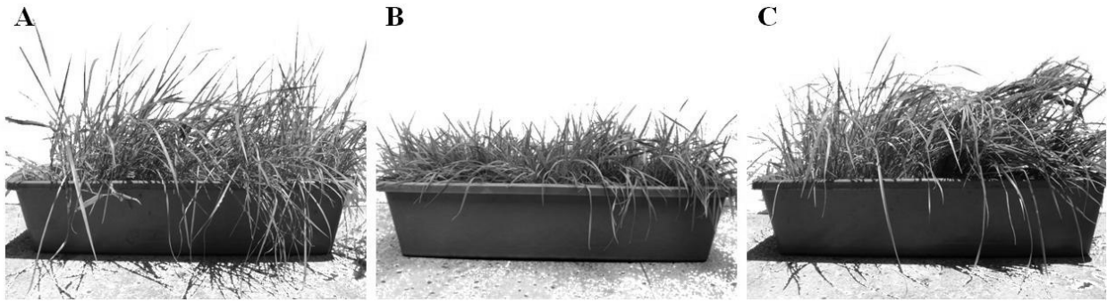
Figura 1. Efecto Cd y Hg en las características morfológicas de B. dictyoneura . (A) Control. (B) Tratamiento con Cd (125 mgkg -1 ). (C) Tratamiento Hg (125 mgkg -1 ).

5 mg Kg -1 . En la figura 2 se observa una disminución gradual en el contenido de Cd, presentando una correlación estadísticamente significativa ( p > 0,05 ) entre el tiempo de exposición y el contenido de Cd en el suelo, con un coeficiente de correlación del 0,97 y describiendo para este comportamiento una cinética de orden cero expresada en la ecuación 1.